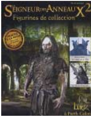
Le seigneur des anneaux (2)

En guise de rappel , voici quelques unes des encyclopédies lancées pendant les fêtes :