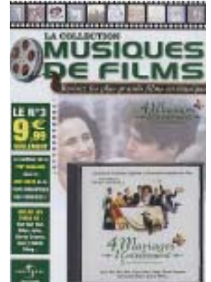
Musiques de films