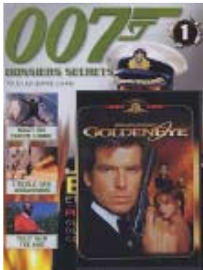
James bond (2)